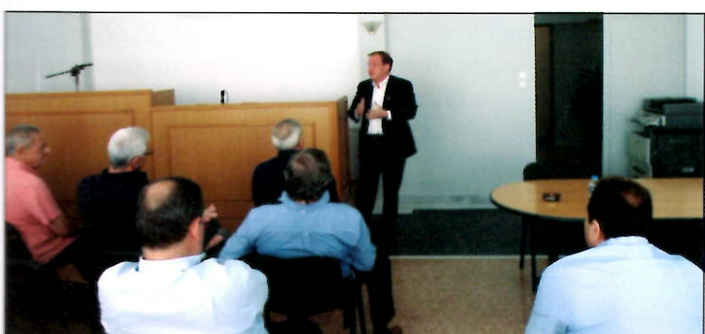
Ο κ. Κώστας Καραμανλής παρουσιάζει τις θέσεις του κόμματός του στα μέλη των δύο Δ.Σ.

Με την παρούσα επιστολή «γνωριμίας» σας ενημερώνουμε για το νομοθετικό πλαίσιο που διέπει τη λειτουργία των ΚΤΕΛ Α.Ε. και ΚΤΕΛ, καθώς και διάφορα ζητήματα του κλάδου που χρήζουν αντιμετώπισης από το Υπουργείο Υποδομών, Μεταφορών και Δικτύων. Τα ΚΤΕΛ είναι ιδιωτικές συγκοινωνιακές επιχειρήσεις, που συστάθηκαν και λειτουργούν από το έτος 1952 με το Ν.2119/52 και στη συνέχεια με το Ν.Δ. 102/1973 και το Ν.2963/2001, με καθαρά ιδιωτικοοικονομικά κριτήρια, χωρίς κρατικές επιδοτήσεις.