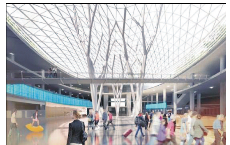
Προοπτική άποψη Κεντρικής Αίθουσας - Αίθριο

Η συνθετική αυτή επιλογή εντείνει τον «δημόσιο» χαρακτήρα της χρήσης καθώς η διαπερατή από το φυσικό φως στέγαστρο επιτρέπει την αναγνώριση του χώρου αναμονής ως ανοικτή δημόσια πλατεία, σε συνέχεια της εξωτερικής πλατείας εισόδου στο Σταθμό.