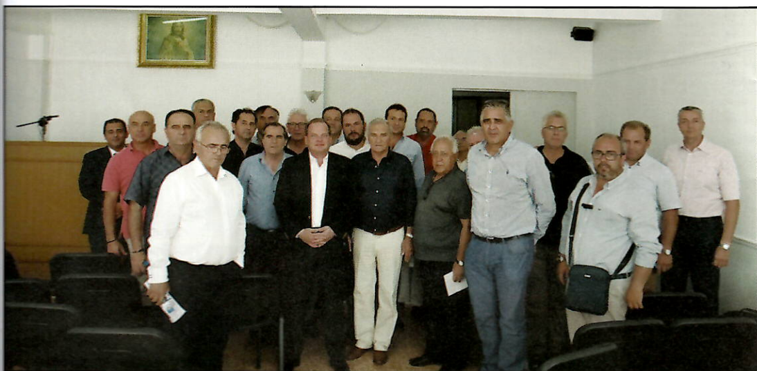
Ο κ. Κώστας Καραμανλής εν μέσω στελεχών του Κλάδου των Υπεραστικών Λεωφορειούχων

δών, συνέχισε στο Πανεπιστήμιο του Harvard στο τμήμα Νομικών Σπουδών με ειδίκευση στην τεχνική της διαπραγμάτευσης για δικηγόρους. Ξεκίνησε την επαγγελματική του σταδιοδρο-