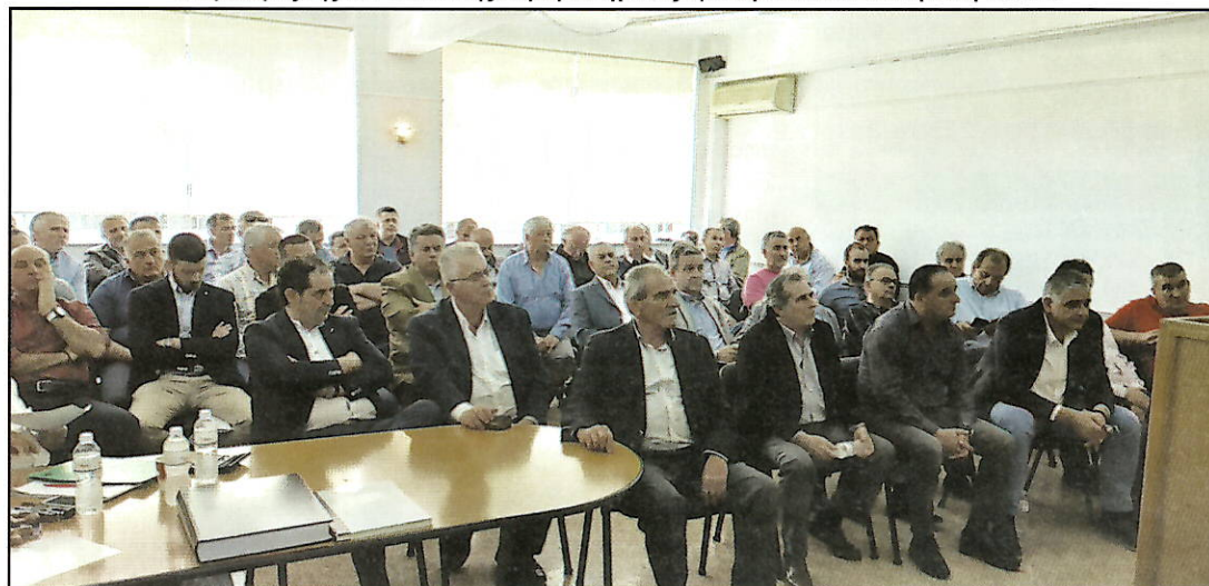
Μέλη του Συνεταιρισμού που παρευρέθηκαν στη Γενική Συνέλευση