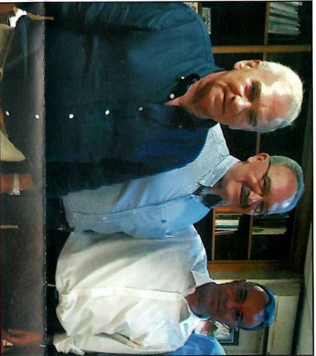
Από αριστερά ο Πρόεδρος της Π.Ο.Α.Υ.Σ. κ. Σοφοκλής Φάτσιος, ο Πρόεδρος της Π.Ο.Α.Σ. κ. Καλλέριος Βουλγαράκης και ο Υπουργός Οικονομικών κ. Χρήστος Σταϊκούρας